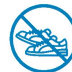
J'évite les efforts physiques