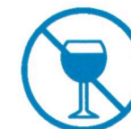
Je ne bois pas d'alcool