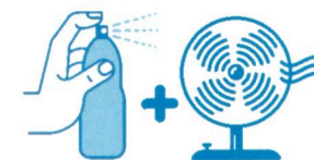
Je mouille mon corps et je me ventile