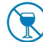
Je ne bois pas d'alcool