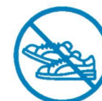
J'évite les efforts physiques