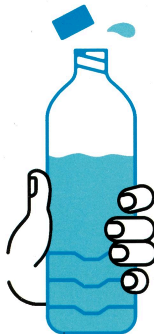
JE BOIS RÉGULIÈREMENT DE L'EAU