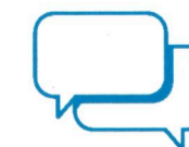
Je donne et je prends des nouvelles de mes proches