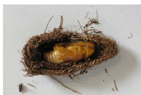
cocon ouvert avec nymphe