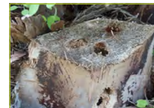
Galeries visibles après la taille