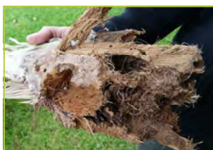
Dégâts & galeries sur palme