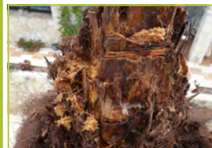
Dégâts & amas de sciure