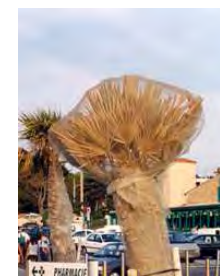
Filet " insect-proof "