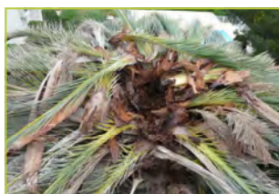
Palmes affaissées (vue de dessus)