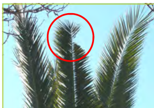
Encoche sur palme