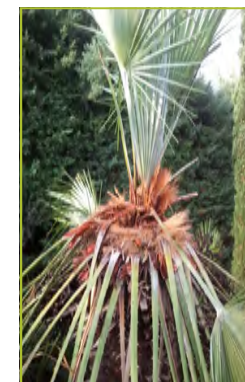
Forte attaque sur Chamaerops humilis